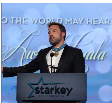
Ben Affleck, comédien et fondateur d'Eastern Congo Initiative (ECI)