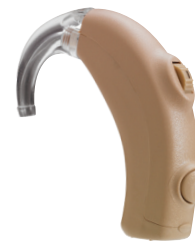
Aries pile 13

Circuit numérique Destiny, programmable multiprogramme omnidirectionnel